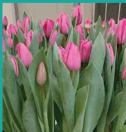
CULTIVAR: Ramblas INZENDER: Hybris

Dit is een kruising van Saigon × Escape. Ramblas is al een aantal jaar getest voor de vroege marktbroei-show in januari en voor de marktbroei tijdens de vakshows in februari. Dit gebeurde altijd als zaailingnummer 1336-4-5. De koelweken van de testen waren altijd vijftien weken, dan krijgt Ramblas ook de goede lengte. Ramblas maakt mooie ronde bollen, is een snelle groeier en is daardoor ook een goede plantgoedgever.