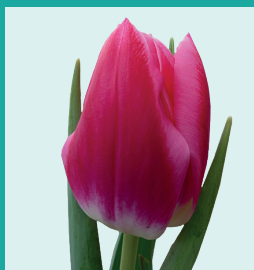
CULTIVAR: Marax Beauty INZENDER: Marax

Dit is een kruising van Saigon × Escape. Ramblas is al een aantal jaar getest voor de vroege marktbroei-show in januari en voor de marktbroei tijdens de vakshows in februari. Dit gebeurde altijd als zaailingnummer 1336-4-5. De koelweken van de testen waren altijd vijftien weken, dan krijgt Ramblas ook de goede lengte. Ramblas maakt mooie ronde bollen, is een snelle groeier en is daardoor ook een goede plantgoedgever.