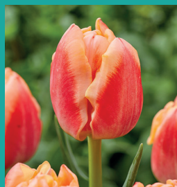
CULTIVAR: Bed of Roses INZENDER: Vertuco

Deze tulp zit zeer goed in de huid, is niet gevoelig voor zuur en heeft een grote knop. Ook is het blad mooi donkergroen, is virus goed te zien en geeft deze tulp genoeg aanwas. Het is een cultivar voor februari. De tulp geeft een zware bos in de broeierij en groeit gelijkmatig. Het is een vlotte broeier.