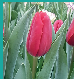
CULTIVAR: Red Bluff® INZENDER: Maveridge

Dynamo® komt uit een kruising met eigen nummers van Remarkable Tulips. Deze tulp is vanaf tweede week januari tot het eind van het seizoen goed te broeien en met 21 kasdagen een vlotte broeitulp. Dynamo® heeft een mooie stand, rechtopstaand blad en een ruime poot.