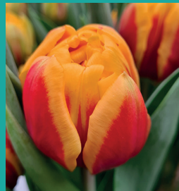
CULTIVAR: Vuelta INZENDER: BoLa veredeling

Dit is een kruising tussen Petra × Greetje Smit. In de teelt is het een probleemloze tulp die normaal plantgoed geeft en goed groeit. Virus is duidelijk zichtbaar en de tulp is er niet heel gevoelig voor. In de teelt behoort deze tulp tot het middensegment. Een zwaardere tulp die zeer gelijkmatig groeit en 23 kasdagen nodig heeft. Verder zijn kenmerken: een goede houdbaarheid, mooi donker groengrijs blad de knop die als hij nog heel jong en groen is al vroeg een ordepunt bovenin heeft.