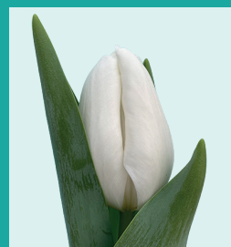
CULTIVAR: Snowwhite INZENDER: Borst bloembollen

Vuelta is een prachtige dubbele roodgele tulp uit de stal van BoLa veredeling. Het is een kruising van Kees Nelis × Double Price. Het is een hele goede groeier die genoeg leverbaar als plantgoed geeft. De tulp groeit altijd boven de 1 op 2. Door zijn sterke ouders is hij weinig zuur- en virusgevoelig. Hij is te broeien vanaf 1 februari met 13 weken kou. Vuelta geeft voldoende lengte en gewicht. Kortom, een echte aanwinst in het dubbele segment.