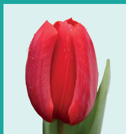
CULTIVAR: Back to Life INZENDER: Kwekerij S. Schouten

Deze dubbele lilapaarse tulp met witte rand is een kruising van Wirosa × Double Price®, gemaakt door Mellema. De tulp is te broeien vanaf 15 februari en is zowel geschikt voor water- als potgrondbroei. Fairplay® is qua kleurstelling een nieuwkomer in het assortiment. Met lengte en een uitbundende knoppresentatie (goed dubbel). Het aantal kasdagen ligt rond de 21 dagen. Verder is het een mooie bollenmaker die goed in de huid zit. In de teelt echt een productietulp.