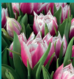
CULTIVAR: Fairplay® INZENDER: Double Future

Pacha is een kruising van Ile de France × Yellow flight. Het is een mooie ronde bollenmaker met aanwas, die tot nu toe niet gevoelig is voor zuur. De tulp zit goed in de huid en moet laat geroid worden. Virus is te zien op de bloem door een donkere onderbreking en vlammen. Voor bladselectie zie je blauwe strepen op het blad. Pacha is een lengtemaker. Er is totaal teeltrecht van 50 hectare. De cultivar lijkt op Ile de France in de broeierij en de kleur rond. Hij is goed te gebruiken in het latere broeiblok.